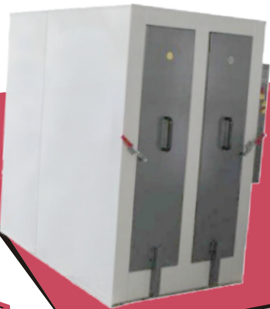
Plate Baking Oven AG-800V / 1100V / 1300V